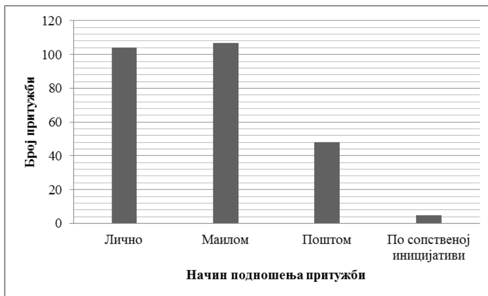
Графикон 1. Начин подношења притужби Заштитнику грађана