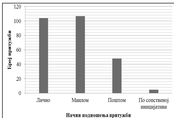
Графикон 1. Начин подношења притужби Заштитнику грађана